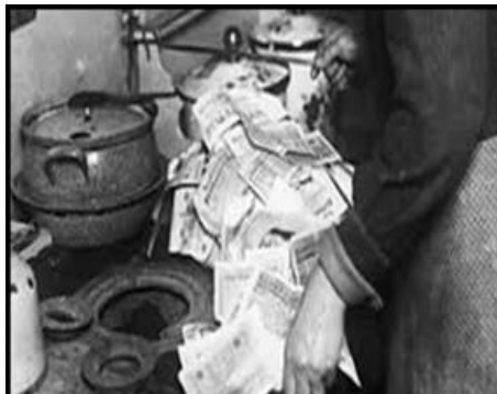
Kinders speel met stapels geld