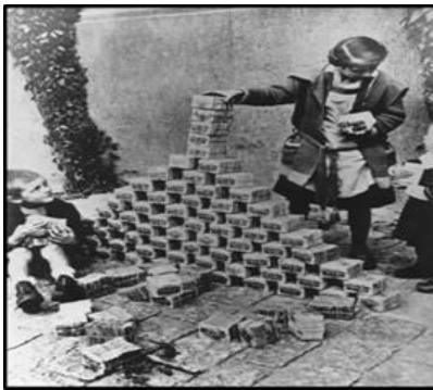
Kinders speel met stapels geld