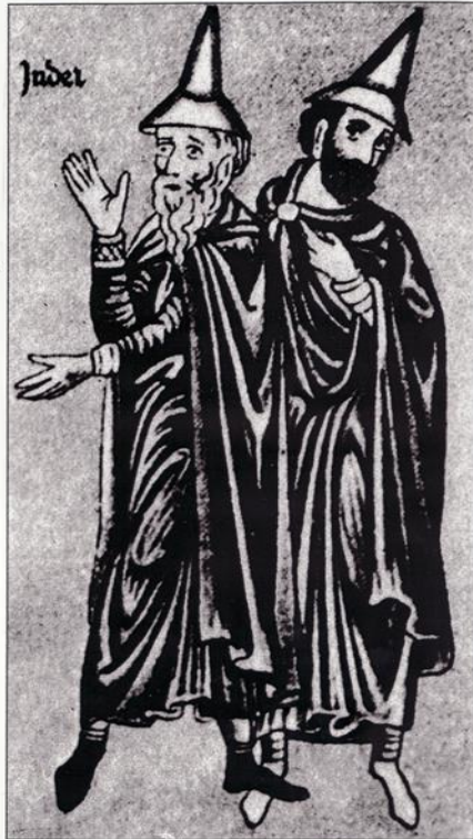
An early 13 th century illustration of Jews wearing pointed hats in accordance with the order by Pope Innocent III at the Lateran Council of 1215